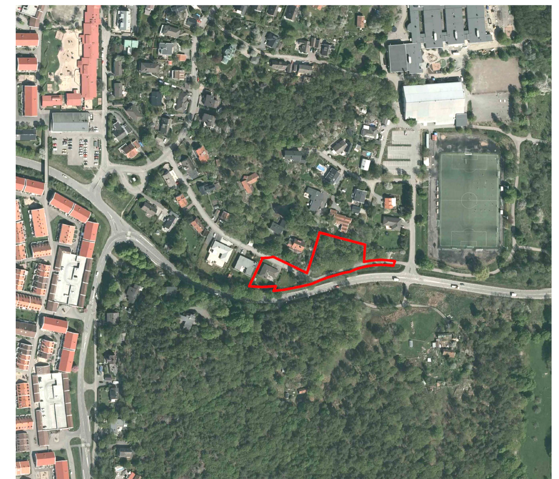
Ortofoto med planområdet rödmarkerat (Stadsbyggnadskontoret).