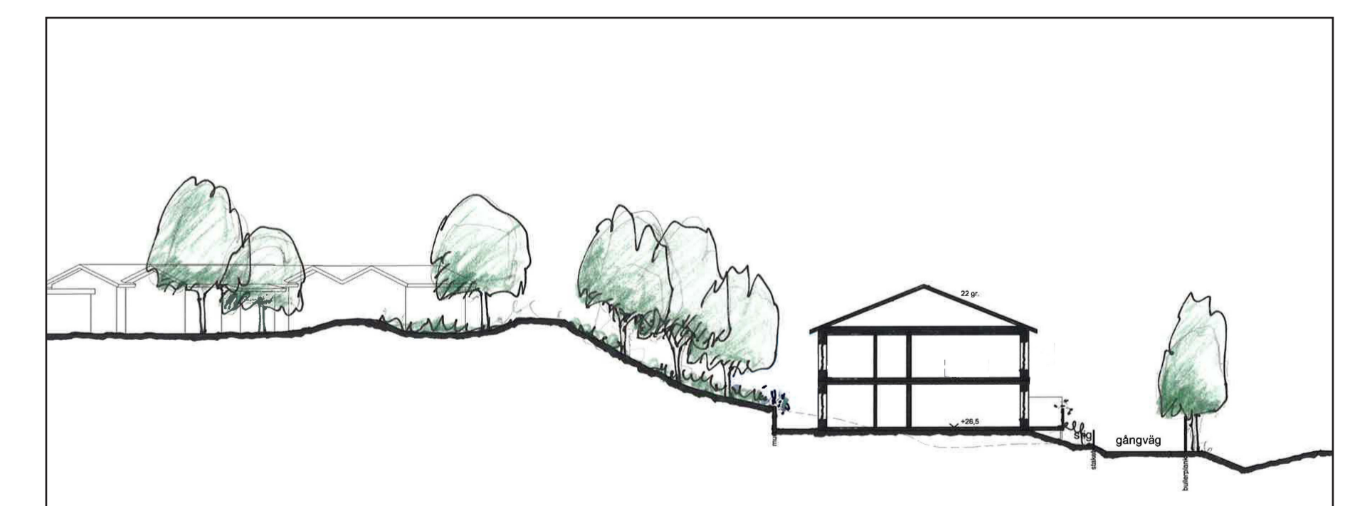
Sektionsskiss från väster (Norconsult AB/Stadsbyggnadskontoret).